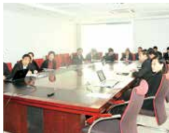
党委、工会、审计中心述职

集团各中心、子公司、营销系统及分支机构分别对2014年度工作进行了全面总结，并对2015年度的工作作了规划和安排。