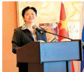
中国驻以色列大使高燕平女士致辞