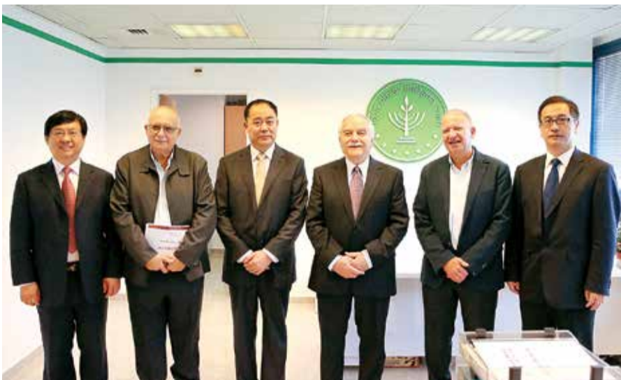
沙米尔部长与万连步董事长一行合影留念