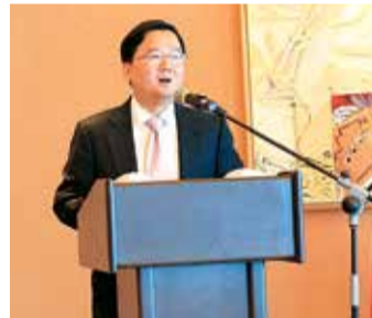
山东省科技厅厅长刘为民介绍山东—以色列科技合作情况