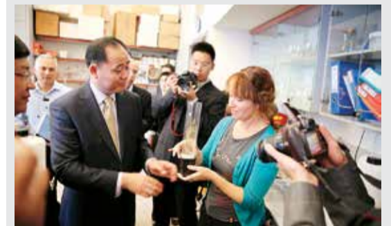
万连步董事长一行参观以色列农业部基因研究中心