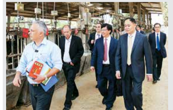
万连步董事长一行参观以色列农业部奶牛培育基地