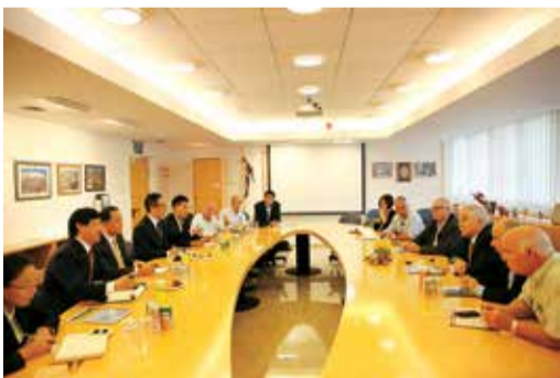
沙米尔部长与万连步董事长一行座谈交流