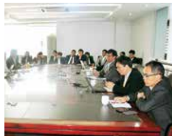
市场中心、商学院述职