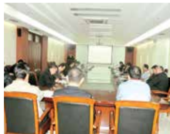
生产技术中心述职