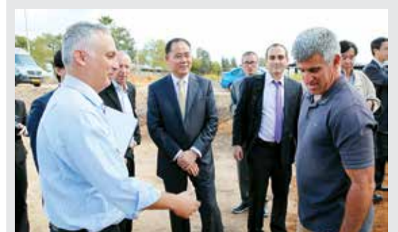
万连步董事长一行参观以色列农业部草莓培育基地