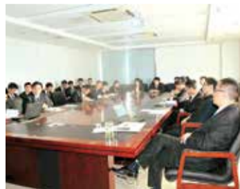
战略与投资中心述职