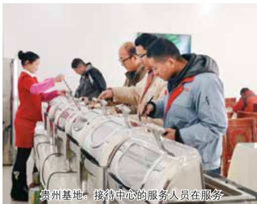
贵州基地：接待中心的服务人员在服务