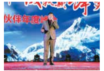
“大衣哥”朱之文倾情演唱