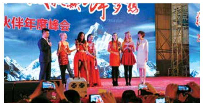
“五洲辣妹”亮相晚会