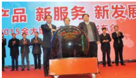
中邮—金大地联合运营团队组建项目启动仪式