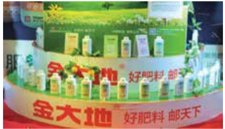
公司研发的金大地新产品上市

本报讯 通讯员王鲁阳报道 12月5日, 2014—2015年度全国邮政分销业务肥料冬储集中洽谈会暨邮企合作会议在集团召开。中国邮政集团总公司副总经理张荣林、山东省邮政公司总经理马志民以及来自全国17个省市邮政分局领导、专家学者及相关企业近200人参加会议。集团董事长兼总裁万连步、副总裁罗文胜出席会议。