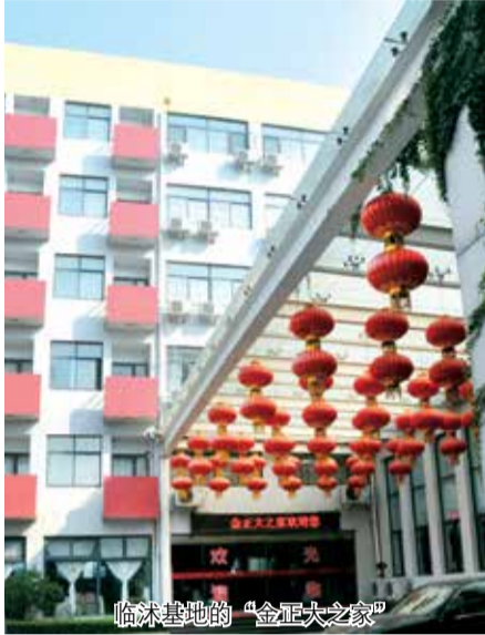
临汾基地的“金正大之家”