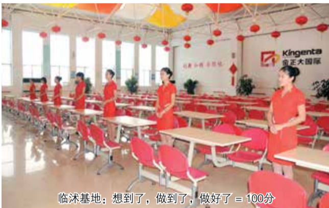
临汾基地：想到了，做到了，做好了 = 100分