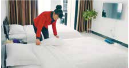
贵州基地：接待中心的服务人员正在整理客房

这是一个微笑最多的地方，这是一个最能感动客人并留下深刻印象的地方，这是一个最能体现金正大软实力的窗口，这里是金正大之家——接待中心。这里还有一群用活力、耐心、贴心、细心去服务的微笑天使，有了她们，才让更多的客人记住了金正大，记住了金正大之家的温暖。