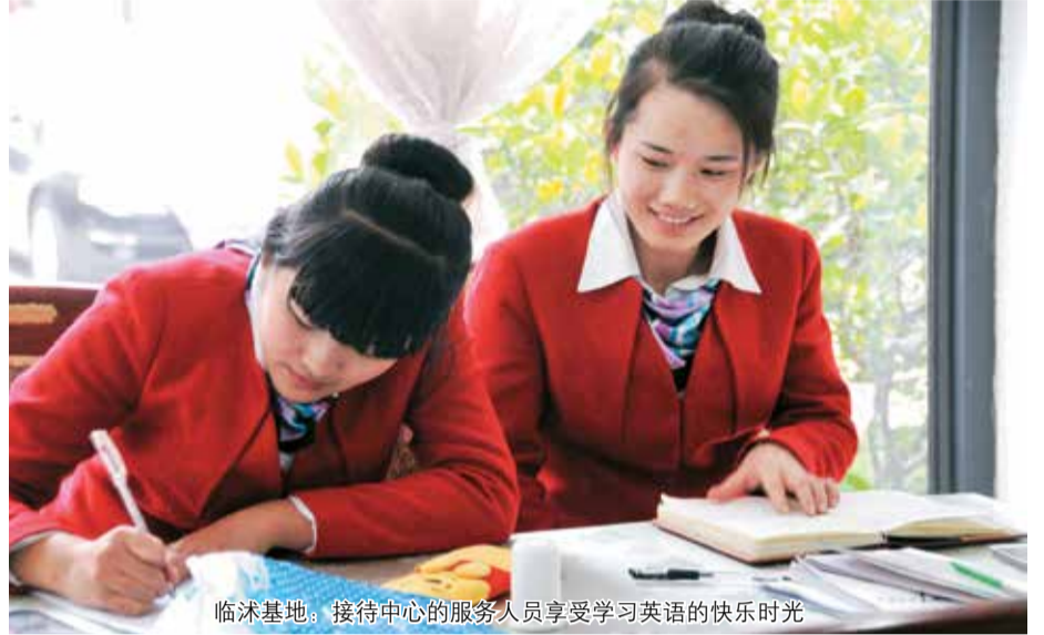
临汾基地：接待中心的服务人员享受学习英语的快乐时光