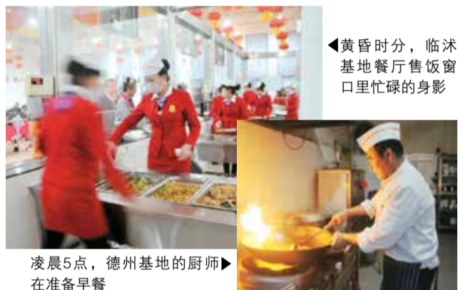
凌晨5点，德州基地的厨师在准备早餐