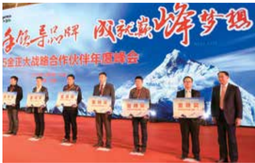
万连步董事长为获得“金穗奖”的优秀经销商颁奖