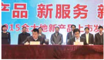
中邮—金大地联合运营团队组建签约